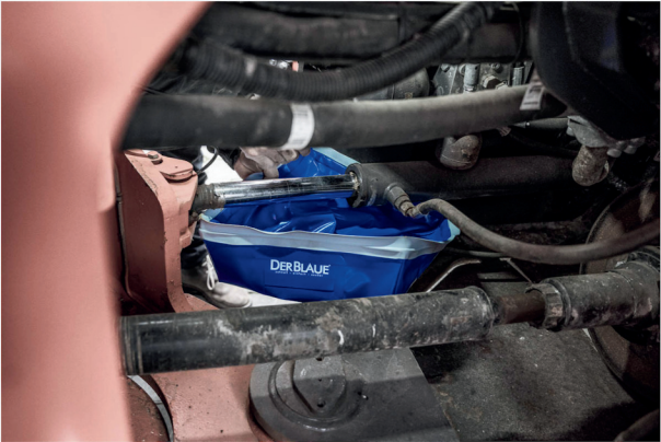
Leichtes Handling in schwer zugänglichen Situationen