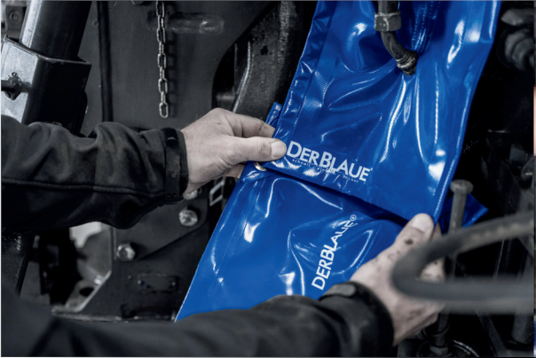
Rutsche und Rosette kombiniert, für maximale Sauberkeit