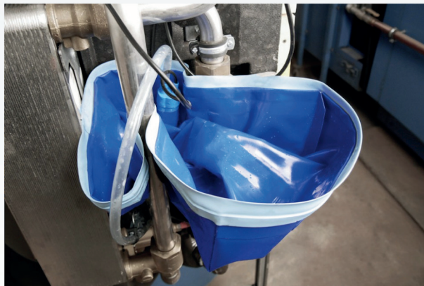
Ideal für enge Einbausituationen