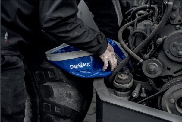
Die Wanne in Form biegen, um jede Ecke und Kante