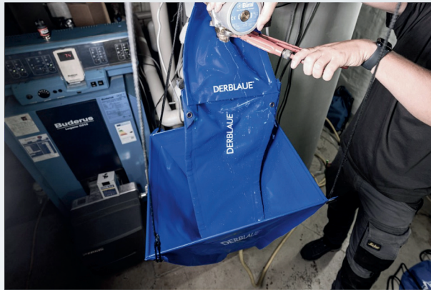
Perfekt für den Pumpentausch