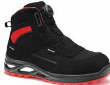
Boa® Fit system