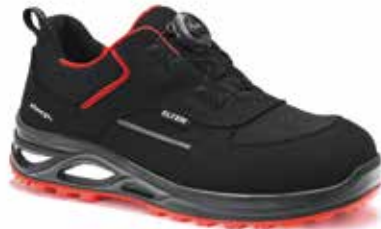
Boa® Fit system