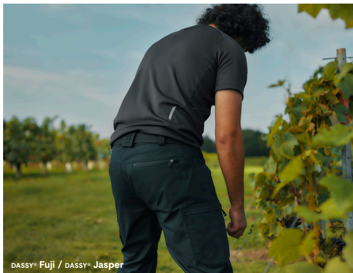
DASSY® Fuji / DASSY® Jasper