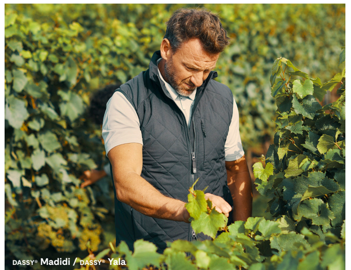
DASSY® Madidi / DASSY® Yala

Zertifizierung: EN 343:2019 klasse 4-4-X